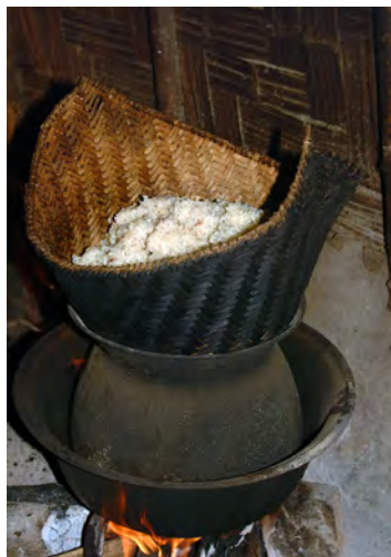
餅米をふかす(ラオス)