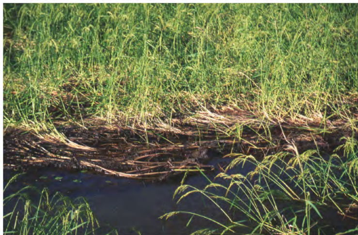
穂をつけた浮稲(タイ)