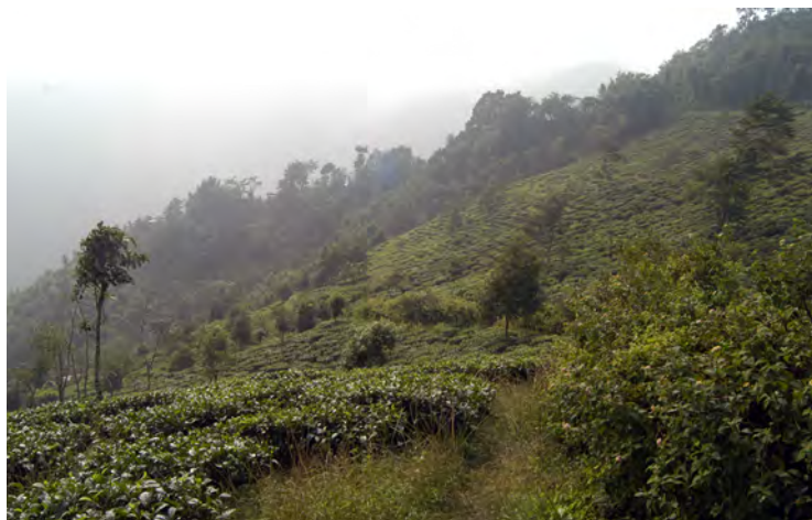
ダージリン郊外の茶畑(インド)