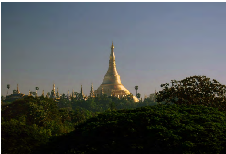
ヤンゴン、シュエダゴン・パゴダ(ミャンマー)