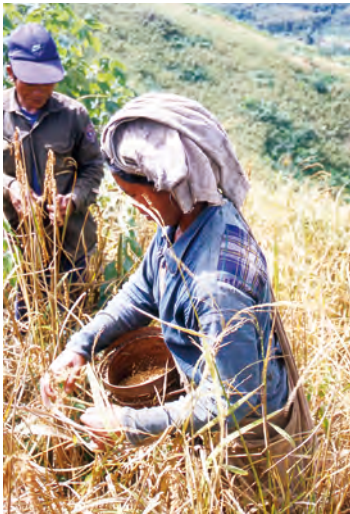
素手で脱穀をおこなう女性(ラオス)