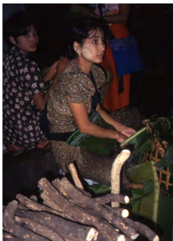
顔にタナカを塗った女性(ミャンマー)