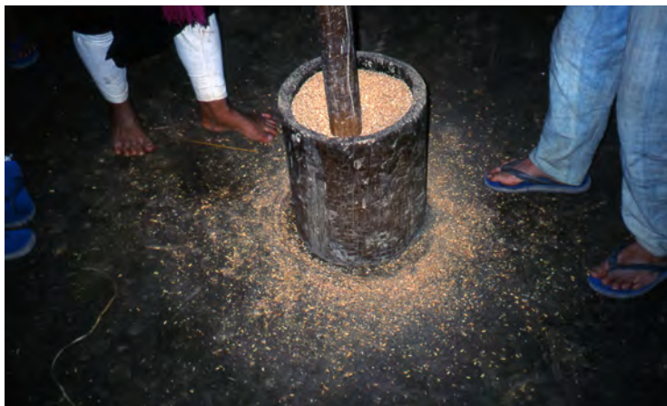
米搗きの杵と臼(ラオス)