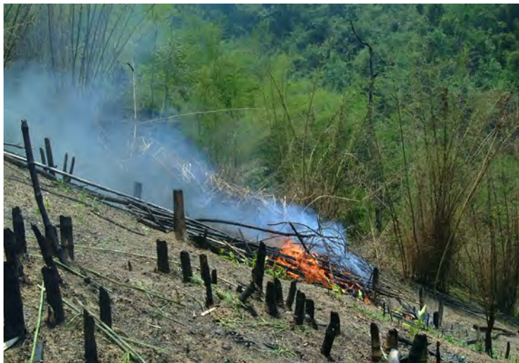
焼畑の風景(ラオス)