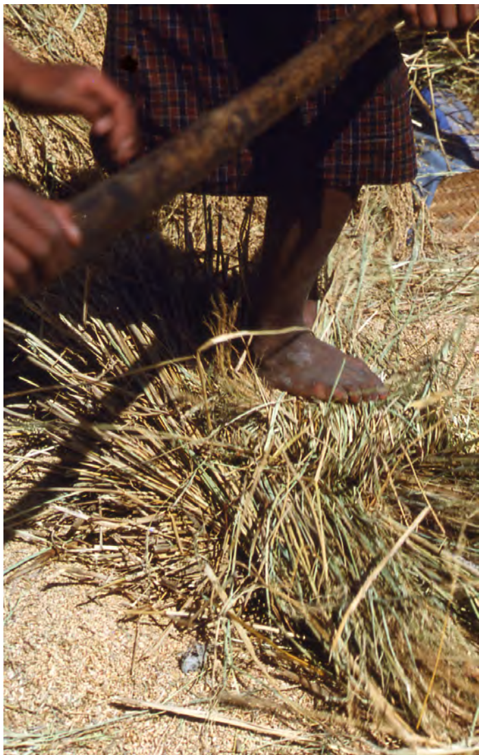
足ふみ脱穀(ブータン)