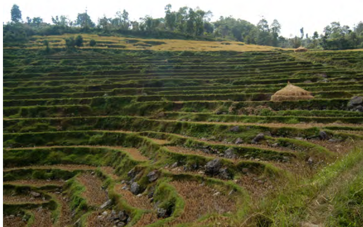
シッキムの棚田(インド)