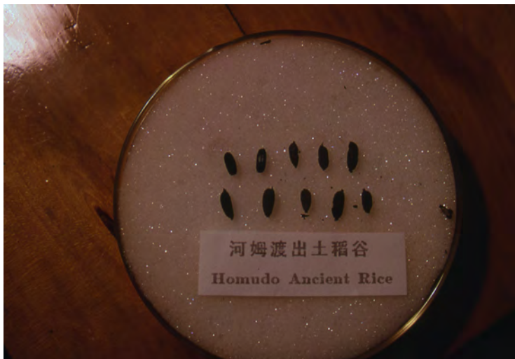
浙江省の河姆渡遺跡出土の最古のイネ種子(中国)