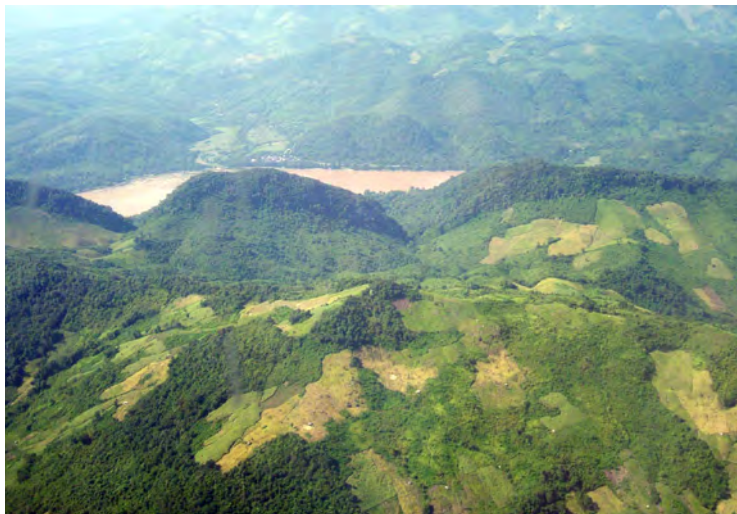
ルアンパバン、焼畑とメコン川(ラオス)