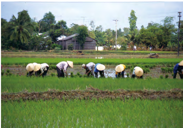
田植えの光景(ベトナム)