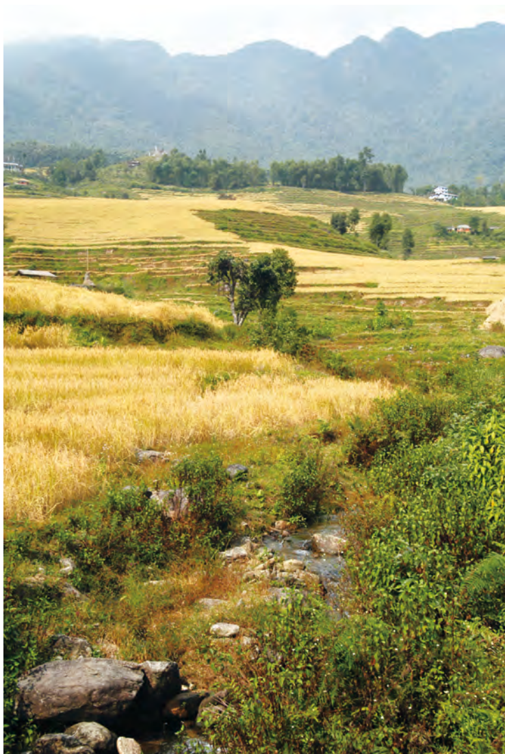
シッキムの棚田(インド)