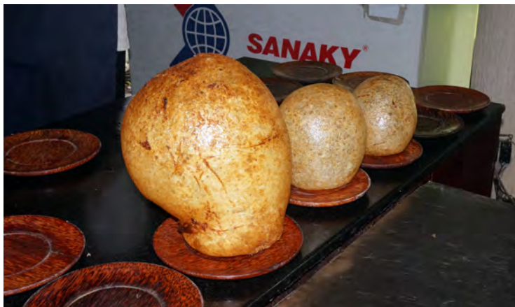
ボール状の揚げ餅(ベトナム)