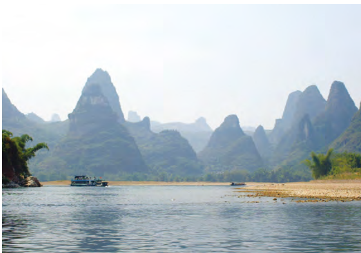
桂林の奇山・奇岩(中国)