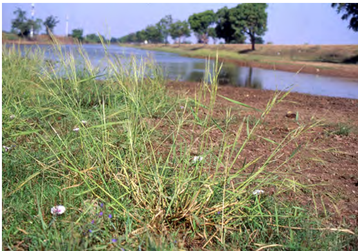
アユタヤ郊外、1年生の野生イネ(タイ)