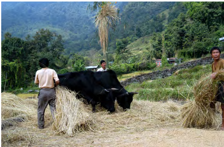
シッキムの脱穀(インド)