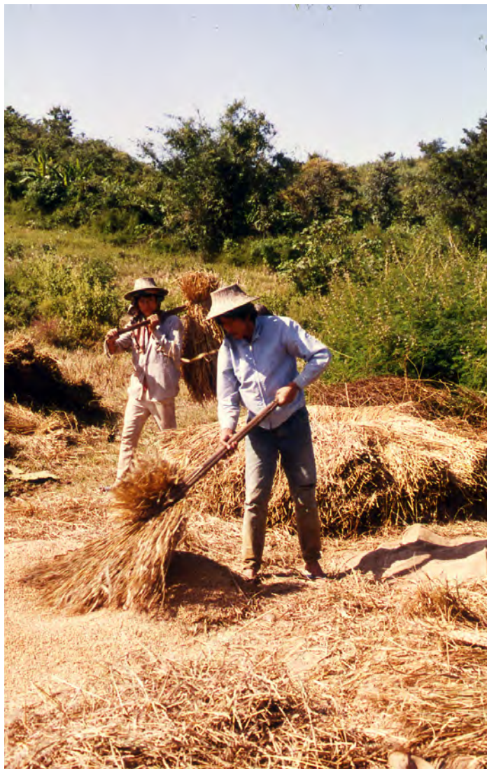
稲刈りの光景(タイ)