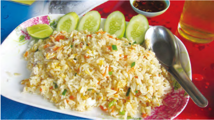
タイのチャーハン、カオ・パツ