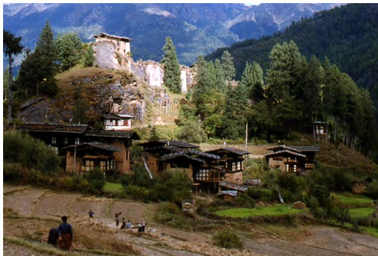
ブータンの最高水田