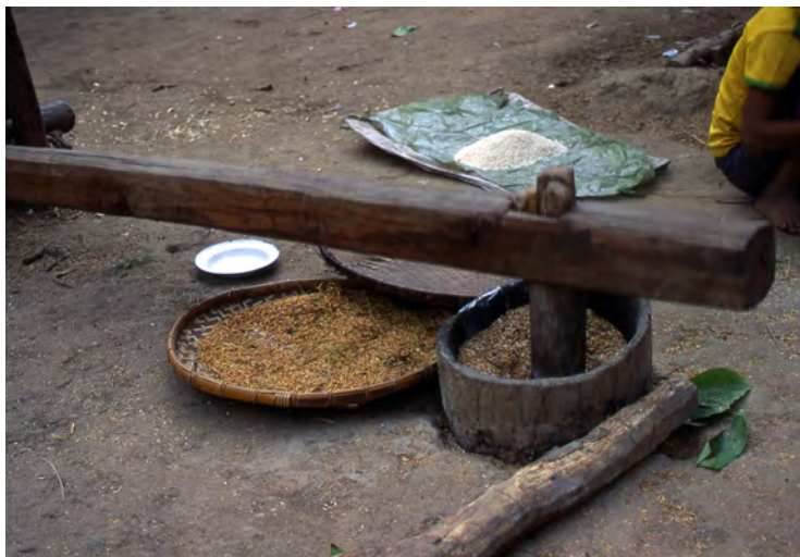
村の米搗き(ラオス)