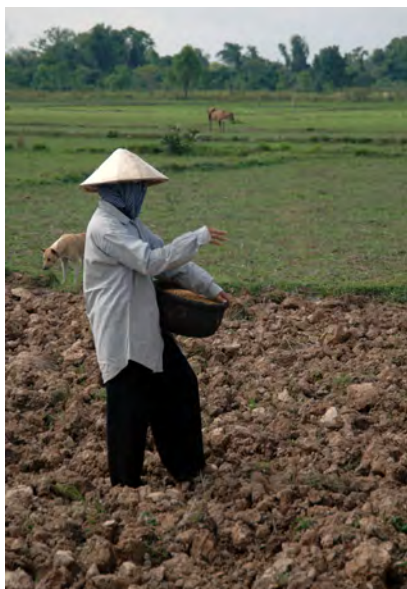
種蒔きの風景(カンボジア)