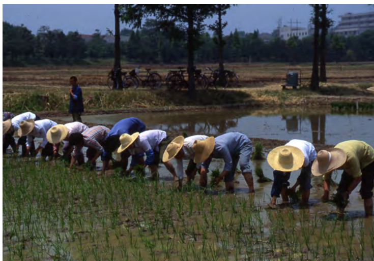
田植えの風景(中国)