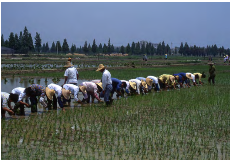
田植えの風景(中国)