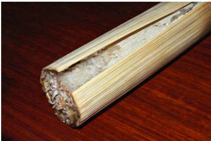
タイの餅米料理、カオラム