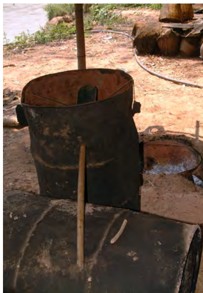
米焼酎の蒸留装置(ラオス)