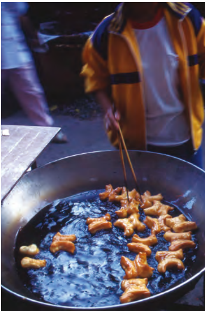
タイの揚げドーナツ、パトンコウ