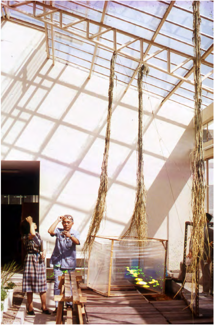
収穫された浮稲(タイ)