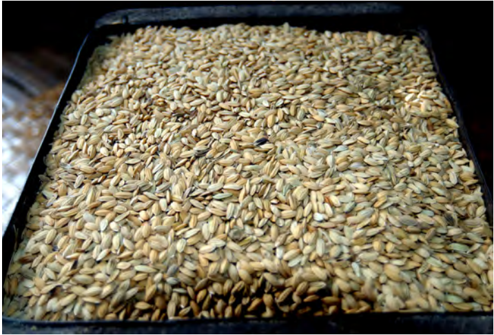
一斗缶に詰められた粳(ラオス)