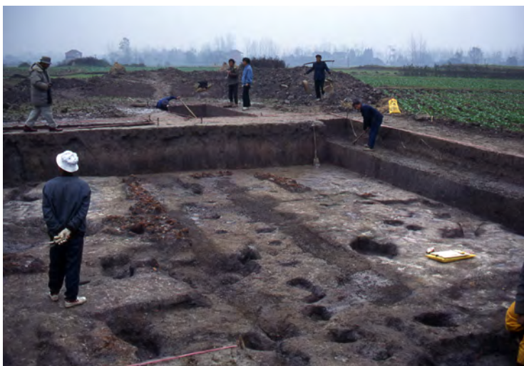
湖南省の城頭山遺跡(中国)