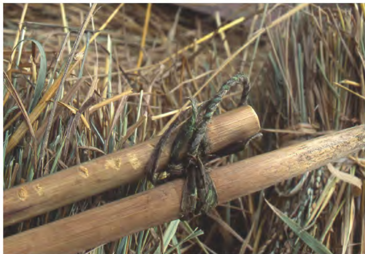
脱穀に使用するマンチャク(タイ)