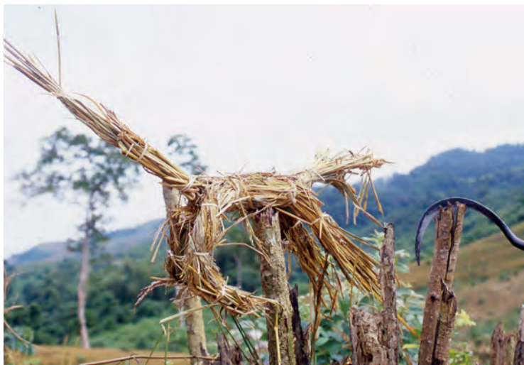
米を守るための魔除け用の藁人形(ラオス)