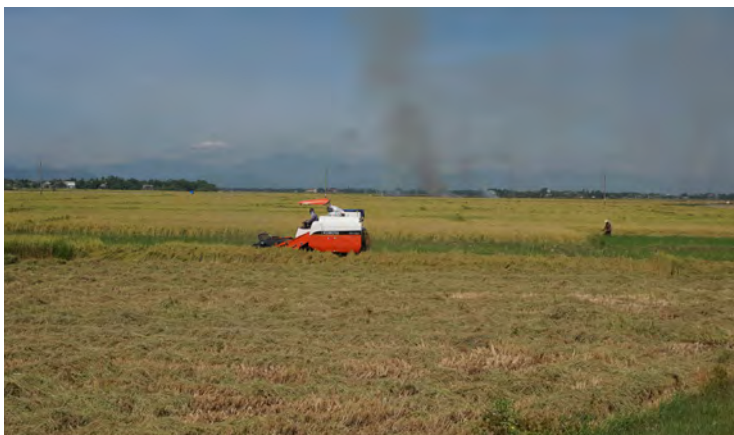
フェ郊外の稲刈り風景(ベトナム)