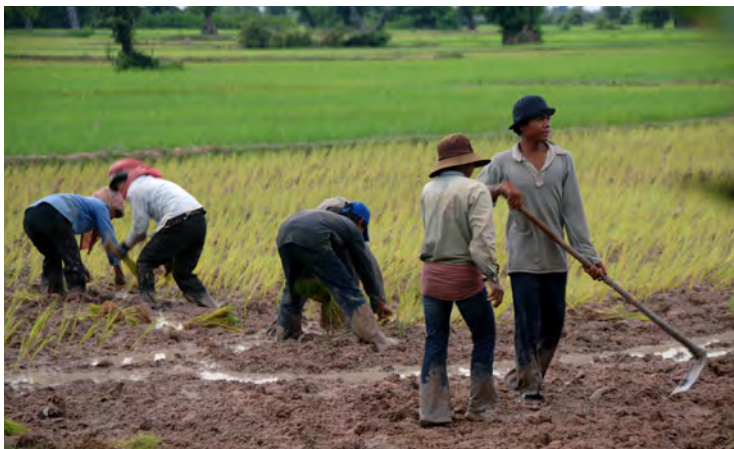
田植えの風景(カンボジア)