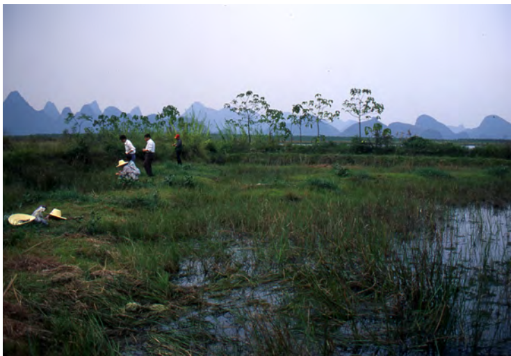
桂林での野生イネの調査(中国)