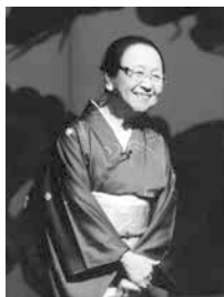
馬場あき子 | はば あきこ 歌人