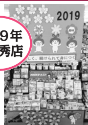
明林堂書店 青山店様(大分県)