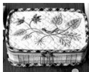
付録 作品の型紙・図案