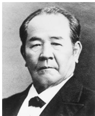
渋沢栄一（深谷市所蔵）

渋沢栄一は、実業家だったのか。挫折と変転を繰り返し、一見矛盾に満ちた渋沢の生涯。その奥にある一貫した行動原理とは何か。「論語」の独自解釈から生み出された思想を、大ベストセラー『現代語訳 論語と算盤』の守屋淳がわかりやすく解説し、渋沢の全体像を明らかにする。「論語と算盤」という両極の組み合わせの思想から、答えのない時代を生きるヒントが見える！