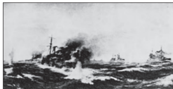
日露艦隊主力の対戦（『日露戦史写真帖』下巻 1915）